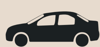
TABELA DE TARIFAS R$